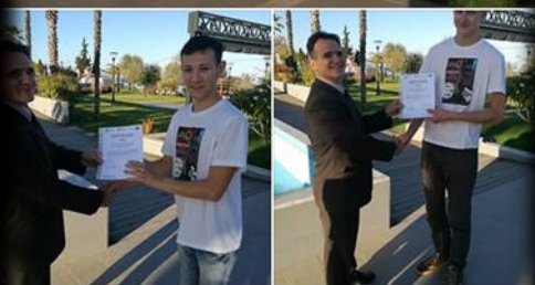
Diagnostowanie i naprawa pracy układu kontrolny trąkacji w pojeździe