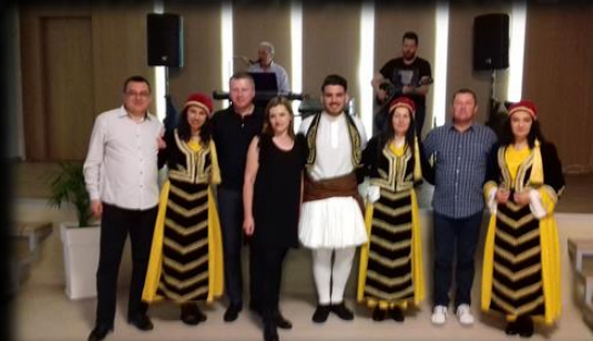
Wieczór kultury greckiej