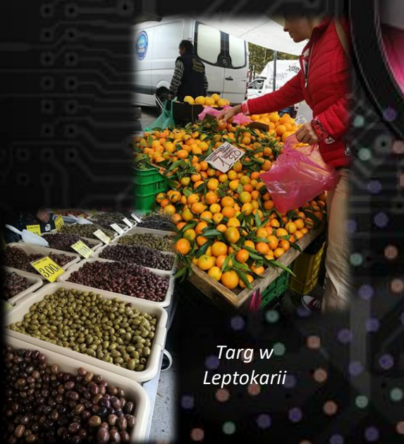
Targ w Leptokarii